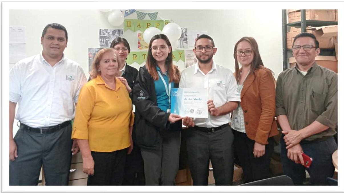
Fotografías capturadas durante la entrega de reconocimientos en las distintas gerencias.