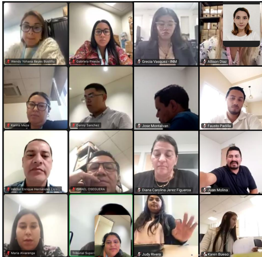
Capturas de pantalla de la Capacitación acerca del “Código de Conducta Ética del Servidor Público” impartida por el Tribunal Superior de Cuentas.