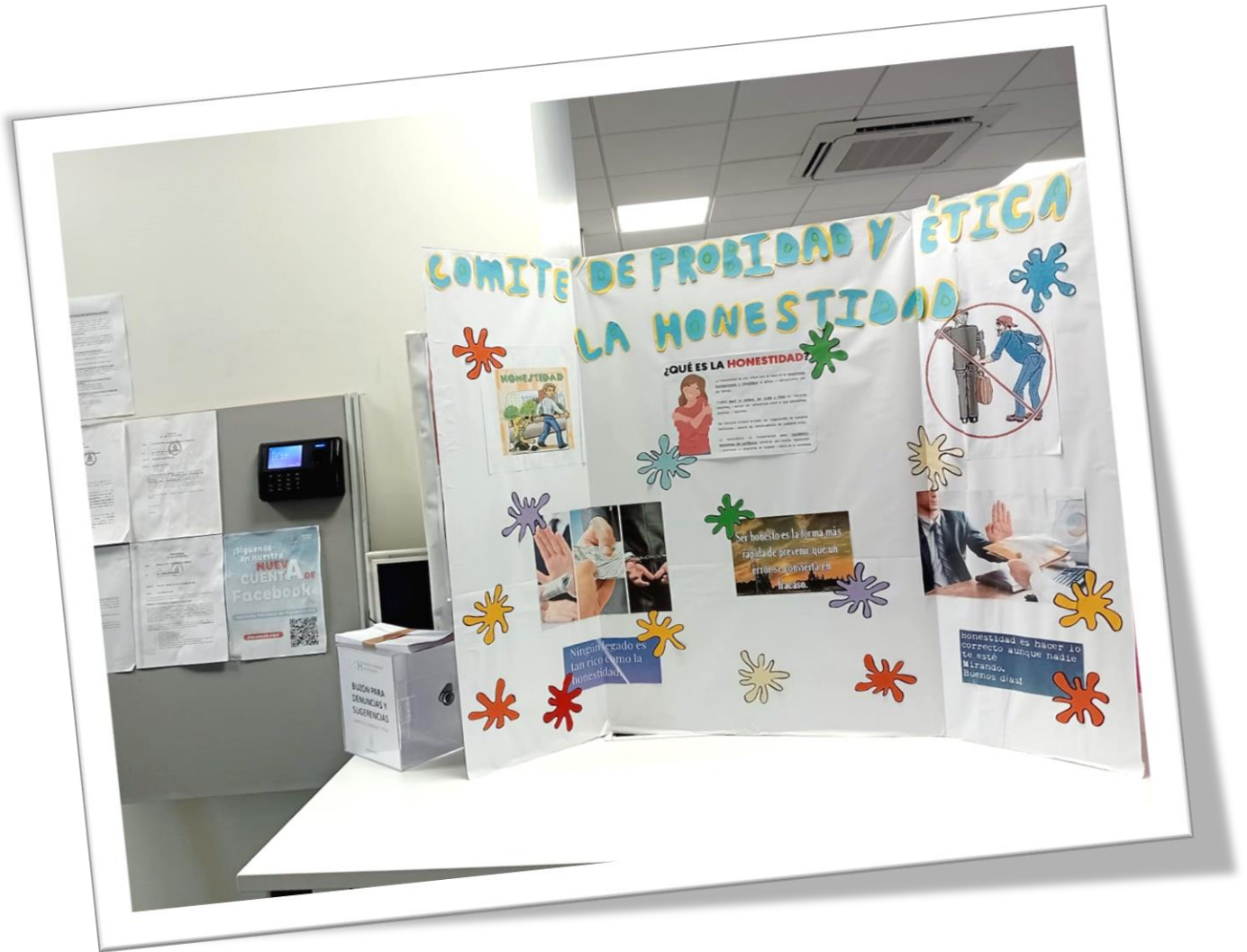
Fotografía del Mural acerca del Valor de la Honestidad.