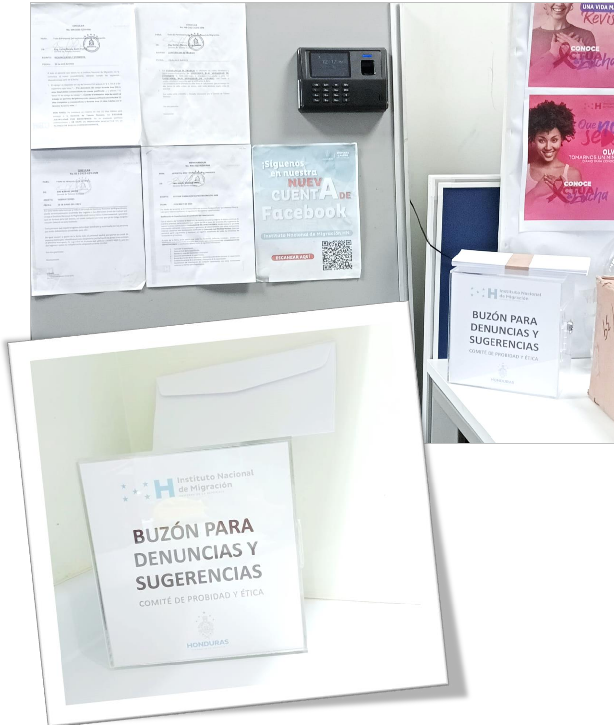
Buzones físicos instalados por el Comité de Probiidad y Ética del INM.